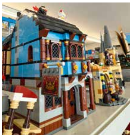
Une activité à option: les constructions de Lego (photo privée).

Dans le cadre d'une activité complémentaire facultative (ACF), des élèves du Cercle scolaire de Val-de-Ruz ont travaillé sur un projet personnel, mêlant créativité, construction et narration, en Lego. En l'espace de quatre matinées, chaque enfant a dû imaginer et réaliser une scène qui raconte une histoire inspirée d'un lieu du Val-de-Ruz. La dernière matinée s'est achevée par une présentation orale devant un jury ainsi qu'un vote symbolique du public pour valoriser le travail accompli. pif/comm