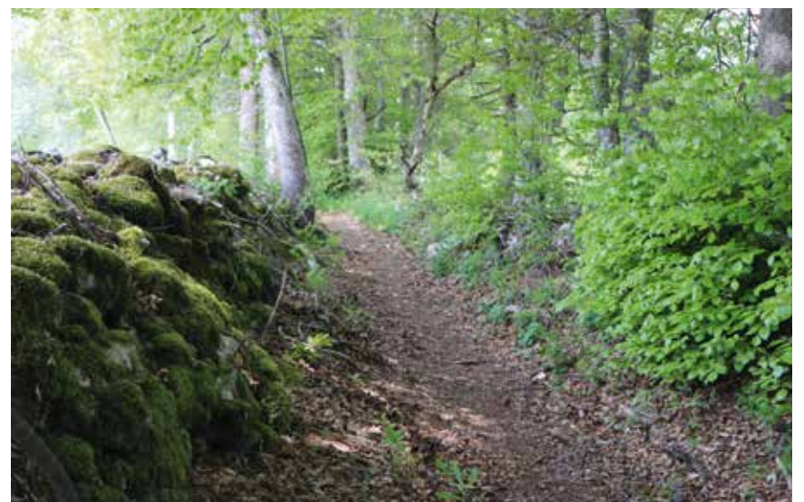
Les chemins creux font aussi l'objet d'entretien.

Ces différentes actions se poursuivront cette année, dès le moment où la météo le permettra. Un accent important sera en plus encore mis sur le patrimoine arboré. Le projet prévoit de planter 70 arbres fruitiers en vue de rajeunir des vergers déjà existants. /comm-pif