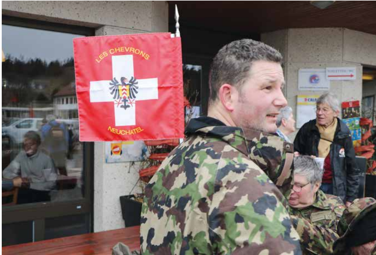
La Marche du 1 er Mars, c'est un rendez-vous avec la tradition.