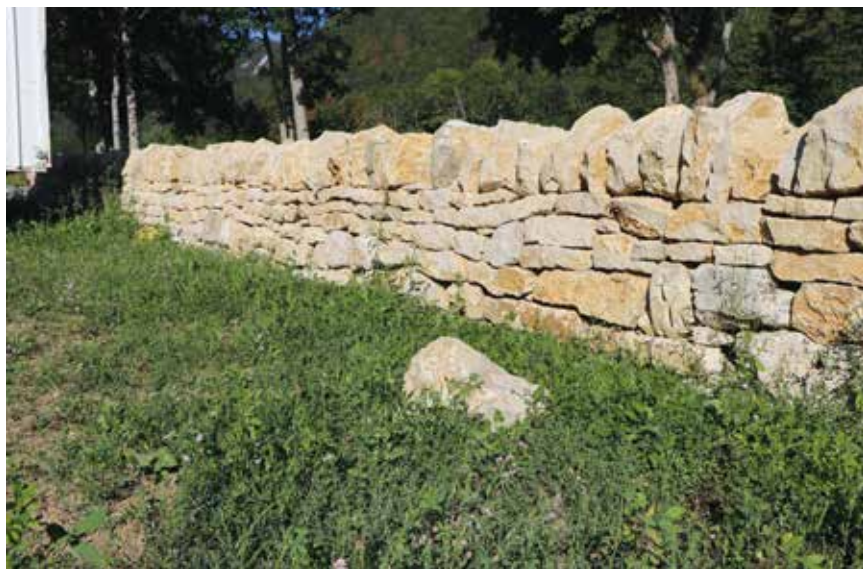
Les travaux de revitalisation concernent les murs en pierres sèches et les chemins creux.

Restauration d'une fontaine au Pâquier, ouverture d'anciens chemins creux et remise en état de murs en pierres sèches: la commune de Val-de-Ruz et le Parc régional Chasseral tirent un bilan et poursuivent leurs efforts communs de valorisation du paysage. Des actions entreprises dès 2024 et qui perdureront jusqu'en 2028.