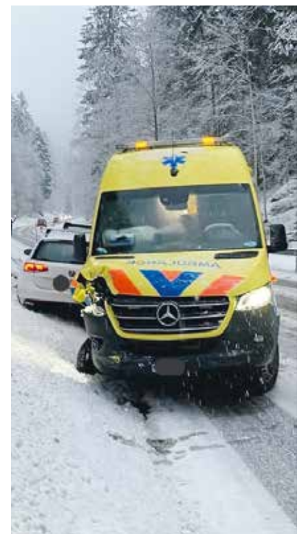
Deux blessés légers dans cet accident impliquant une ambulance.

lait en direction du Pâquier. Il aurait freiné en croisant l'ambulance peu avant l'accident. pif/comm