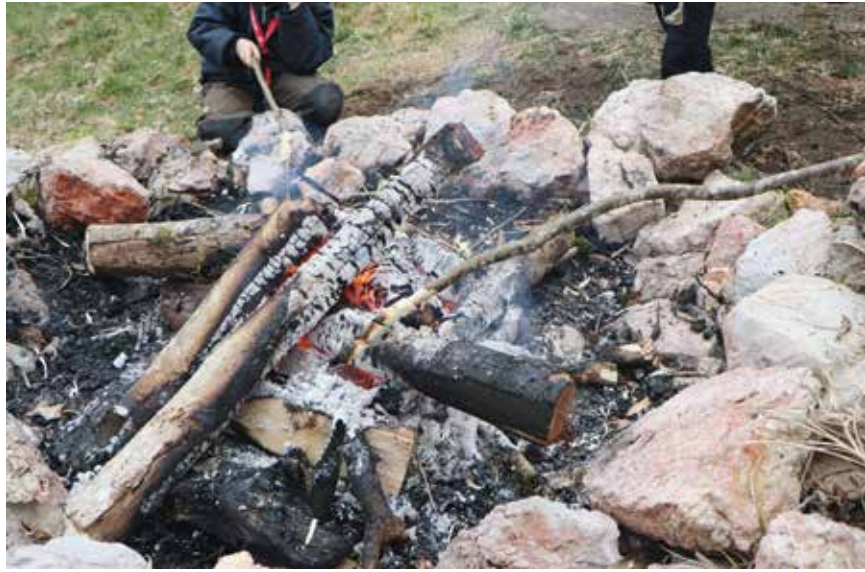
Confectionner du pain de trappeur: le Passeport-Vacances proposait l'an dernier un après-midi d'aventure avec les scouts.

Soutenir les structures d'accueil parascolaires privées et promouvoir les activités du Passeport-Vacances: ce sont les deux pistes envisagées par le Conseil communal de Val-de-Ruz en réponse à la motion «Offrir un encadrement aux enfants durant les vacances scolaires».