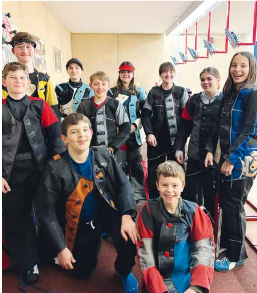
Les juniors de «La Rochette» Montmollin cartonnent au tir petit calibre.