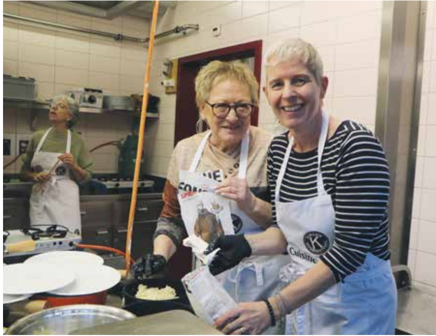
Les dames préparent les caquelons pour ces messieurs qui «touillent».

C'est un événement incontournable au Val-de-Ruz. La 44 e édition des 12 heures du fromage s'est tenue le 7 février à La Rebatte à Chézard-Saint-Martin. Plein feu sur les travailleurs de l'ombre, en cuisine, ceux qui «touillent» la fondue. Mais quelle en est la recette? Secrète?