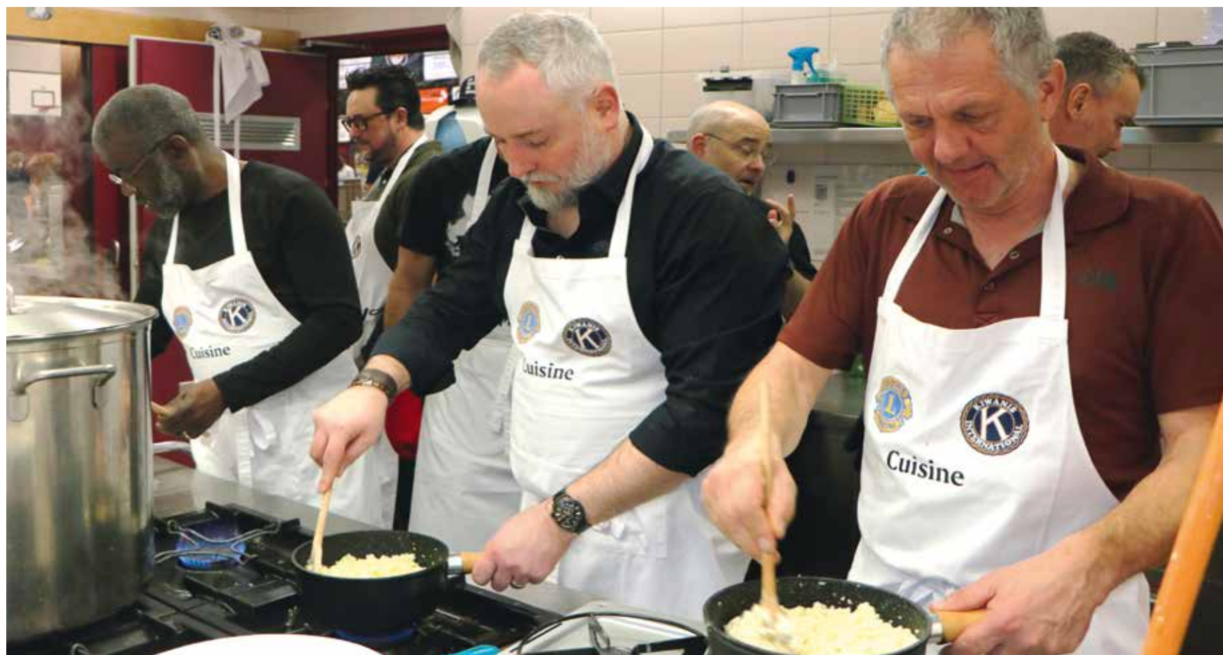
En page 5, les travailleurs de l'ombre très concentrés aux 12 heures du fromage. Mais quelle est la recette de la fondue? (photo pif).